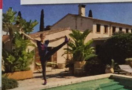
Mein Arbeitsplatz Hier unterrichte ich eine Woche Yoga und lasse mich inspirieren

POWERFRAU Die ehemalige „Blitz“-Moderatorin, 39, ist seit einem Jahr Mutter, unterrichtet mit ihrer Firma „be better“ Yoga an den schönsten Orten und schreibt gerade ihr drittes Buch, das im Herbst erscheint