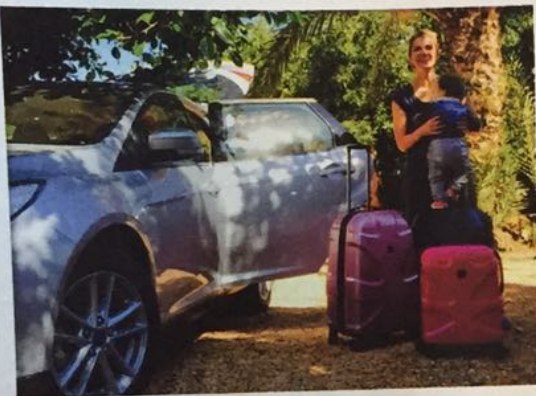
Angekommen! Mit viel Gepäck und voller Vorfreude beziehen wir unsere Finca