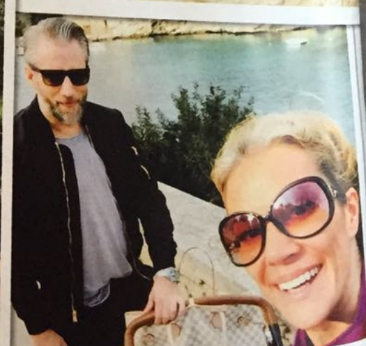
Mit Baby unterwegs Zusammen mit meiner Tochter machen wir einen Ausflug zum Hafen von Porto Cristo: Mittagspause de luxe