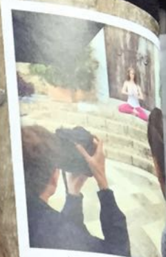
Ohnmim PR-Shooting für meine neue DVD „Chakra Yoga“ vor Traumkulisse

POWERFRAU Die ehemalige „Blitz“-Moderatorin, 39, ist seit einem Jahr Mutter, unterrichtet mit ihrer Firma „be better“ Yoga an den schönsten Orten und schreibt gerade ihr drittes Buch, das im Herbst erscheint