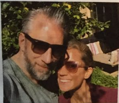
Happy! Wie schön, dass auch mein Liebster mit dabei ist