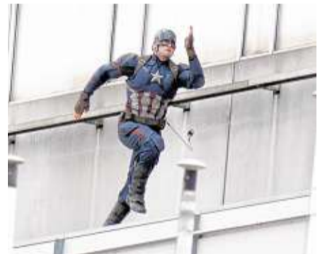
Ein Stuntman im Captain-America-Kostüm auf dem Dach des ICC

Spider-Man macht die Dächer von New York unsicher, sein Marvel-Kollege Captain America die von Berlin – zumindest in dieser Woche. Am ICC am Messe-damm wurde in den vergangenen Tagen der neue Kinofilm mit dem Superhelden gedreht. In der Hauptrolle: US-Schauspieler Chris Evans . Der wurde bei den allzu halsbrecherischen Szenen an der Fassade des Kongresshauses jedoch von einem Stuntman gedoubelt. Neben Berlin dient auch Leipzig als Kulisse für „Captain America: Civil War“. BM