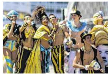
Das „The Wylde“-Ensemble vor der Weltzeituhr am Alexanderplatz HANNIBAL HANSCHKE

Zum Auftakt der neuen Spielzeit hat sich das Ensemble der Show „The Wylde“ aus dem Friedrichstadt-Palast eine Auszeit mit Sightseeing gegönnt. Zuerst zog es Nofretete und ihre Kollegen an den Alexanderplatz, wo die Weltzeituhr bewundert wurde. Im Anschluss verdrehten die 32 Damen der Girlsreihe Berlinern und Touristen am Brandenburger Tor den Kopf. „Die Shows des Palastes gehören zu den Markenzeichen der Stadt“, so Burkhard Kieker , Geschäftsführer von „Visit Berlin“. „Der Palast bietet echtes Weltstadt-Entertainment, wie sonst nur in Las Vegas.“ BM